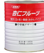
杏仁フルーツ (寒天<赤・白>・黄桃・みかん・パイン)