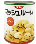
中国産マッシュルーム (スライス)