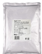
中国産マッシュルーム (P.S.)