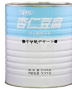
杏仁豆腐 ひし形カット